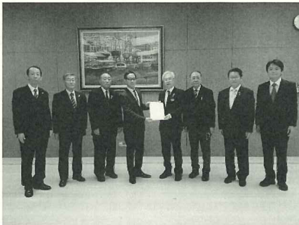
愛知県議事堂にて

令和3年12月6日 愛知県へ愛知県老人福祉施設協議会・西三河地区社会福祉協議会から介護支援専門員の研修体制に関する要望書を提出